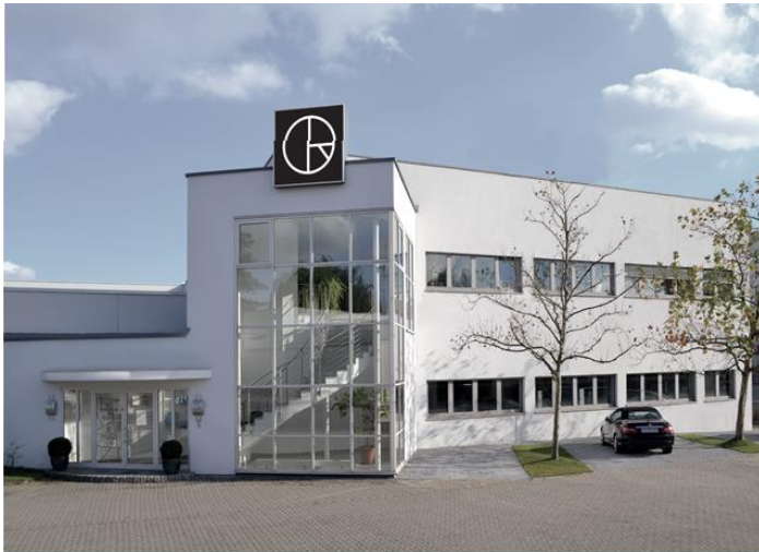
RISSMANN Headquarter, Nuremberg

RISSMANN GmbH Lenkersheimer Straße 26 90431 Nürnberg Tel-Nr. 0911/93196-0 kontakt@rissmann.com